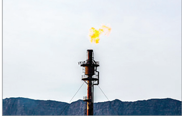
مدیرعامل پالایشگاه بندرعباس از ارتقای کیفیت