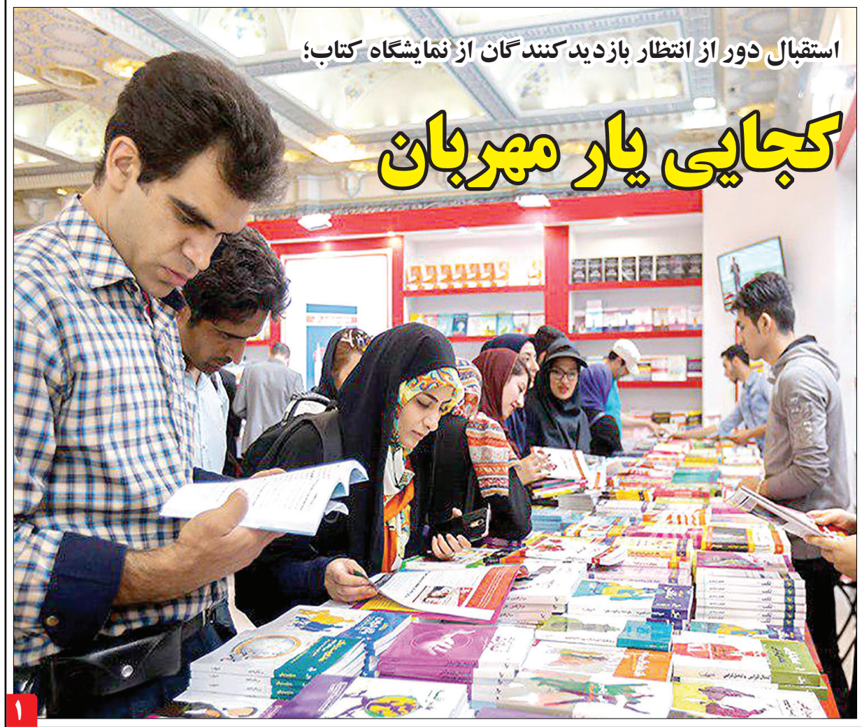
استقبال دور از انتظار بازدیدکنندگان از نمایشگاه کتاب؛