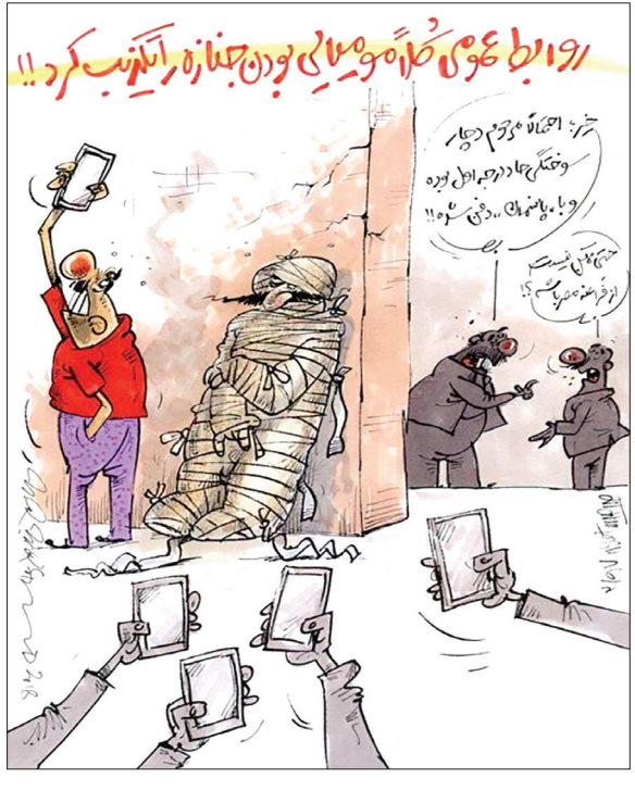
در هاشم جد کشف شه در طرک سهاک حرم حضرت عبدالعظیم... مصرضه میرت دیوه، این کارکارتکاور تومویی را در هفت صبح منتشر کرد.